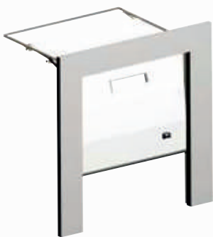
MAIORCA Sectional doors