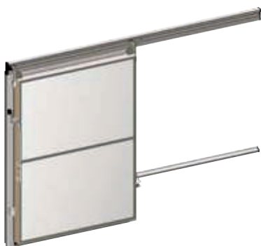
ELBA Sliding doors

portes isothermes portes semi-isothermes portes souples portes industrielles