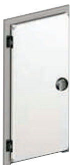
MIKONOS Hinged doors