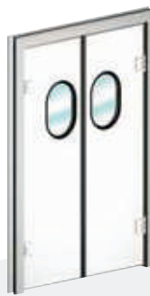
LIPARI To and Fro