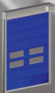
SALINA Up wardind folding doors