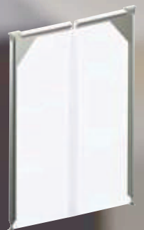
DELOS Flex PVC doors