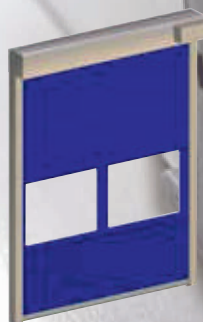
FILICUDI Fast rolling vertical doors